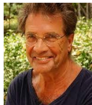
Teun A. van Dijk